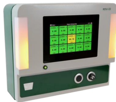
Zobrazovací jednotka RDU-22